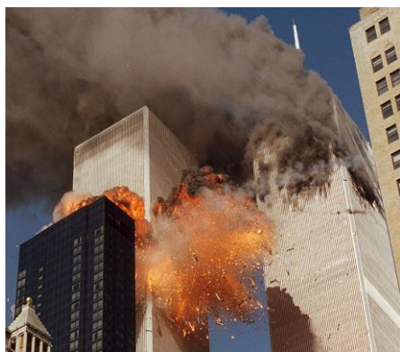
Взрыв террористами небоскребов Всемирного торгового центра в Нью-Йорке 11 сентября 2001 года.

Терроризм – слово, которое сегодня можно часто услышать. Его обсуждают между собой родственники, учителя и просто прохожие. О нем говорят в новостях по телевидению. Террористов показывают в кино и пишут о них в книгах. Взрослых очень волнует эта тема. И, наверняка, они уже говорили вам – что терроризм это большое зло. Только вот объяснить, почему же тогда нельзя взять и уничтожить это зло - непросто. Ученые и политики знают, какое это сложное явление и как тяжело его искоренить. В первой книге для младших классов вы узнали, что такое терроризм, что и зачем делают террористы, как с ними борется государство. Сейчас, когда вы уже больше знаете о мире вокруг нас и лучше разбираетесь в поведении людей, мы возвращаемся к разговору о терроризме. Ведь, для того, чтобы это страшное слово ушло из нашей жизни, надо много сделать, много знать и обладать проницательностью – уметь видеть скрытые причины поведения окружающих.