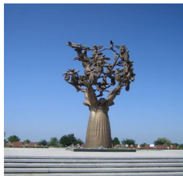
Памятник детям, погибшим во время теракта в г.Беслане.

Когда жизнь людей уносит болезнь – такова судьба или воля Всевышнего. Когда человек гибнет в автокатастрофе, причина – невыполнение правил дорожного движения. Но в случае теракта, причина – воля других людей.