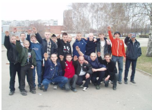
Группа подростков-скинхедов использует нацистское приветствие.

Свойственная этому возрасту идеализация, желание изменить мир, вера в свои силы и лучшее будущее, приводит к завышенности оценок и притязаний, мешает правильно оценить действительность, порождая пессимизм и апатию. Социальная активность подростка часто принимает форму абстрактной социальной критики, он фиксирует свое внимание на том, что его не удовлетворяет, что не соответствует его идеалу. Примером может служить резкость и безапелляционность критических суждений о ситуации в стране, в республике, в городе или поселке, в школе. Это состояние стараются использовать различного рода политические и религиозные течения, пытаясь внушить подростку, что все недостатки, которые он видит, могут быть устранены путем радикальных действий.