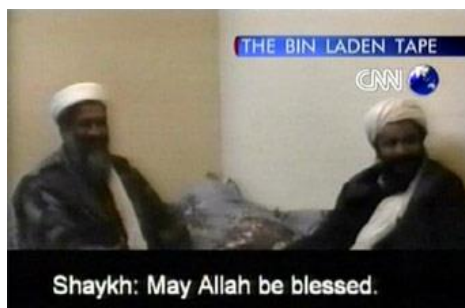
Американский телеканал CNN показывает выступление международного террориста Бен Ладена.

распространения информации и влияния на людей. Из СМИ люди узнают о мире, о мнениях, чувствах и поведении других людей. СМИ, таким образом, способно задавать настроение и определять поведение огромных групп людей. У людей есть потребность в познании окружающего мира и эту важную потребность удовлетворяют СМИ.