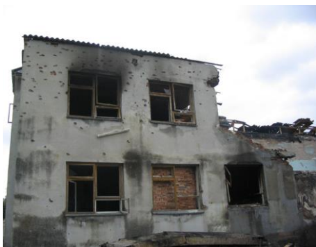
Школа, разрушенная в ходе теракта.

Первая причина, назовем ее объективной, заключается в том, что в мире есть благополучные и неблагополучные страны и регионы. В одних странах развита промышленность, транспорт, много материальных и духовных благ. В других, свирепствуют нищета, голод, болезни. Именно в таких регионах отчаявшиеся люди готовы к любым, даже непродуманным действиям. Главарь террористов подсказывают – «виновники те, кто живет хорошо» и снабжают набранных «борцов» оружием и взрывчаткой. Большинство известных в мире террористов – выходцы именно из таких бедных стран и регионов. В благополучной стране возможны лишь одиночные акты психически неуравновешенных людей, но терроризм как явление слабо выражен.