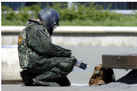
Сотрудник милиции в защитной экипировке специальной аппаратурой и исследует обнаруженный предмет.

Есть несколько практических советов, которые стоит запомнить и стараться соблюдать. Прежде всего, это касается обнаружения подозрительных предметов, которые могут оказаться взрывными устройствами. Подобные предметы обнаруживают в транспорте, на лестничных площадках, около дверей квартир, в учреждениях и общественных местах. Подросток, в силу