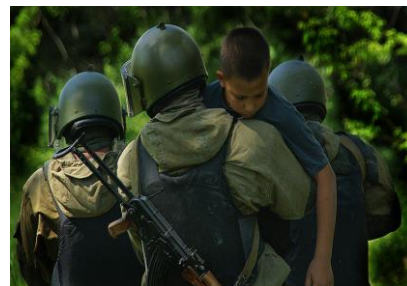
Бойцы спецназа освободили ребенка из рук террористов.