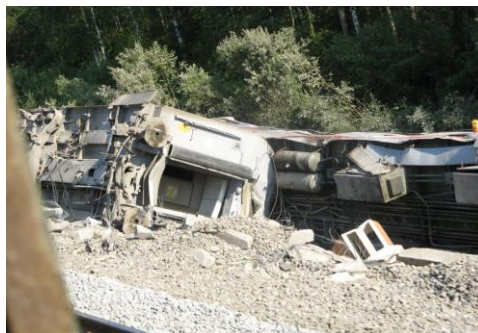
Результаты теракта на железной дороге.

Террористы часто используют оружие и взрывчатку, но это не война. Во время даже самых жестоких войн солдаты стараются не повреждать школы, больницы, религиозные здания и жилые дома. Так как на этот счет существуют жесткие правила ведения войны. Если солдат стреляет по мирным жителям, то такой солдат подлежит строгому суду и жестокому наказанию. Иначе обстоит дело у террористов. Совершая преступления, террористы выбирают такие безопасные для себя места, как больницы, школы, театры, концертные площадки, рынки. Чем больше среди людей,