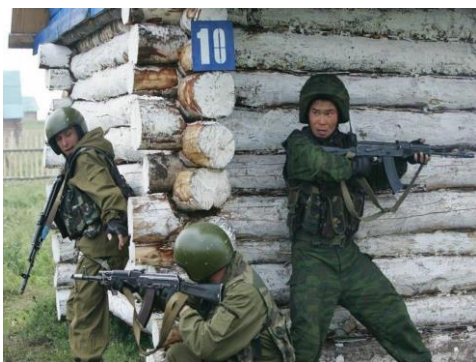
Бойцы группы антитеррора проводят учения по поиску и задержанию террористов.

максимально возможную безопасность заложникам. Большинство терактов последних лет с захватом заложников закончились уничтожением или арестом террористов.