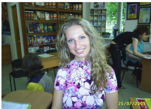
Новичков встречают улыбкой.

Для удержания людей в секте разработано множество приемов. Один из них называется «бомбардировка любовью». Суть его заключается в усиленном создании вокруг новичка атмосферы радости, доброжелательства. Лица сектантов светятся улыбками, они приветливы. Вновь прибывшего могут накормить, будут говорить ему комплименты, восхищаться им. В такой обстановке трудно не поддаться общему настроению. В результате новичок испытывает эффект, сходный с