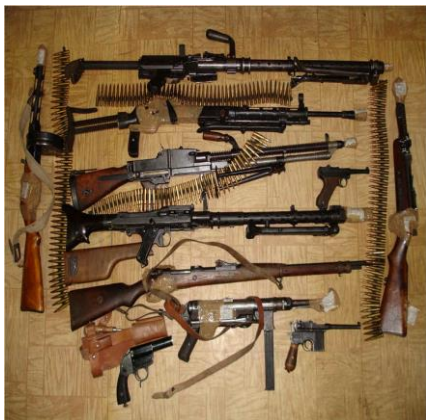
Оружие, изъятое у бандитов.

Некоторые бизнесмены готовы дать деньги террористам, чтобы устранить конкуренцию со стороны отдельных стран и областей. Например, террористический акт в курортном районе может привести к тому, что люди поедут отдыхать не туда, а в другую страну, которая и получит дополнительную прибыль. Или строители откажутся строить газопровод из-за угрозы терактов в одной стране и будут прокладывать его в соседнем регионе.