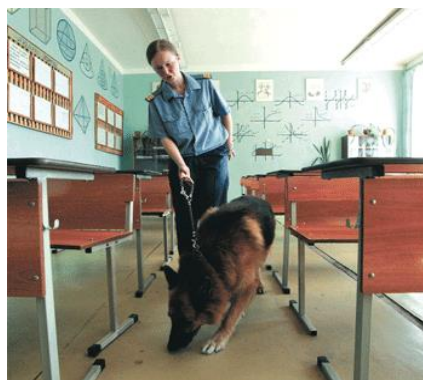
Кинолог с собакой обследует помещения школы.

➤ Каждый случай ложной тревоги тревожит мирных людей, беспокоит, мешает нормально жить. Опасаясь угрозы, эвакуируют школьников, студентов, работников предприятий, жителей домов. Перекрывают дороги, останавливают транспорт. Задерживают отправление