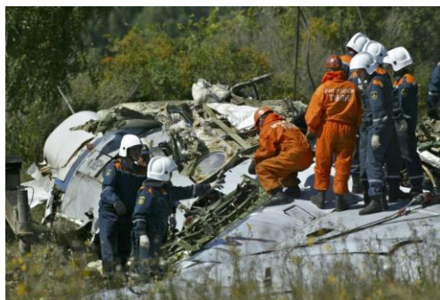
Самолет, взорванный террористами.

В современном мире, к сожалению, много страданий – болезни, преступления, экономические кризисы и войны. Когда умирает больной человек – родственники и друзья оплакивают его, когда погибает солдат с оружием – родина скорбит о нем. Но такая возможность предполагалась, ведь не все болезни мы можем лечить, а солдат, пожарный, милиционер – опасные профессии. Это печально, но соответствует тому, как люди воспринимают этот мир. Но, когда ночью по чьей-то злой воле взрывается жилой дом и погибают спящие в нем люди - рушиться справедливость мира.